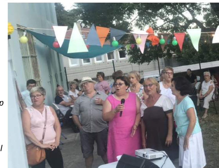
Guinguette du 10 août 2018

Par ailleurs, beaucoup d'entre vous se sont mobilisés pour amener des idées nouvelles au centre social Pierre Rabhi et je les en remercie.