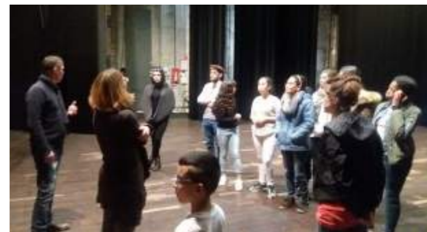
Visite des coulisses du théâtre de Privas avec un groupe d'ados

Beaucoup d'idées sont suggérées par les familles, des sorties (sortie à la ferme pédagogique), des ateliers (Zumba, Cuisine, etc...) voire un week-end en commun !.