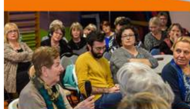
Rencontre de Pierre Rabhi avec les Bénévoles et Professionnels